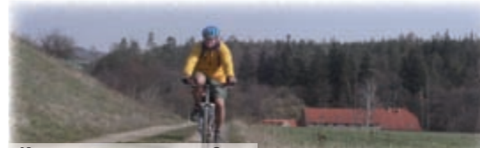
KAM OD ZASTÁVEK CYKLOBUSŮ?

Linka cyklobusu navazuje v Dobřichovicích na vlaky linky S7. Na lince cyklobusu platí Tarif PID a cena přepravy jízdního kola je 26 Kč bez ohledu na vzdálenost. Při využití přestupu v Dobřichovicích z vlaku na cyklobus je jízdné za přepravu kola v cyklobusu sníženo na 13 Kč . Při tom je nutno prokázat se řidiči cyklobusu platným dokladem ČD o přepravě jízdního kola jako spoluzavazadla ve vlaku (cena přepravy jízdních kol dle Tarifu ČD je 25 Kč ).